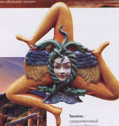
Таормина: средневековый символ Троицы украшает не только дома Таормина, но и сицилийский флаг