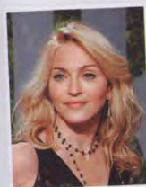
Среди поклонников аппетитного аромата Loukhoun замечена Мадонна

Творения Keiko Mecheri стоят в стороне от европейской парфюмерной традиции: немногие из тридцати семи композиций имеют типичную пирамидальную структуру. Ароматы совсем несложно носить, что отличает их от большинства нишевых брендов, при этом они «звучат» на коже не меньше четырех часов.