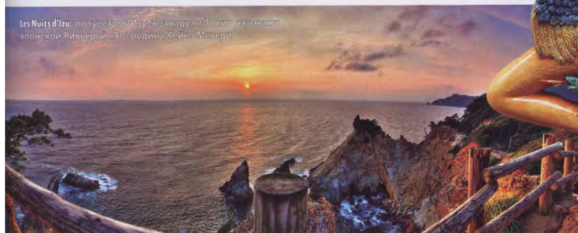
Les Nuits d'Izeu: полуостров Изу в гавани от Токьяо, назван в японской Ривьерой – это родина Кейко Мечери