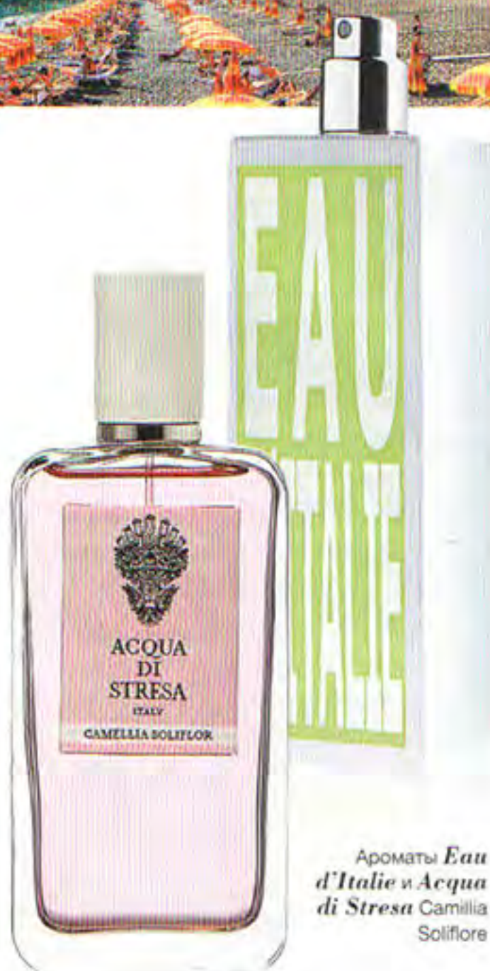
Ароматы Eau d'Italie и Acqua di Stresa Camellia Soliflore