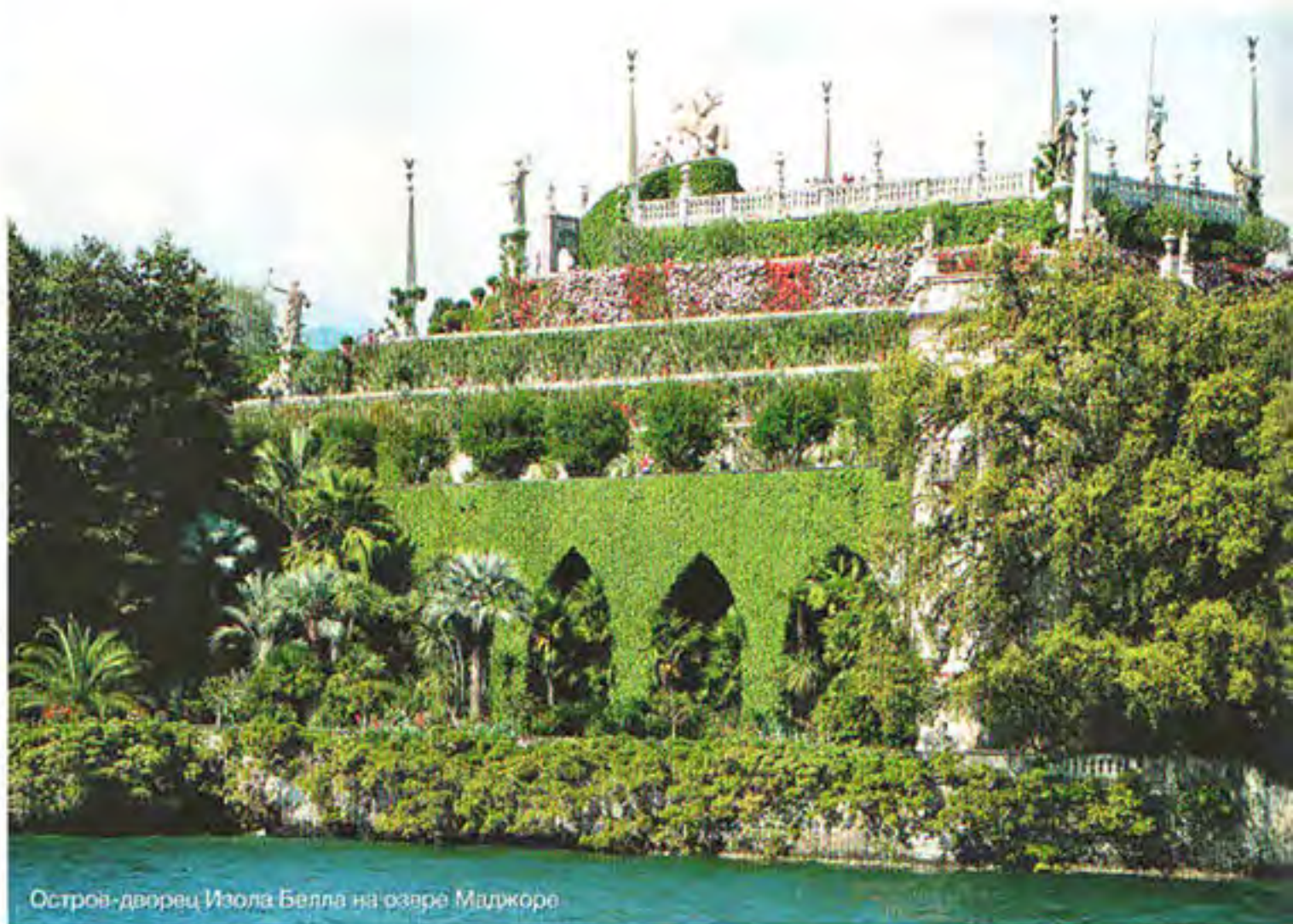
Остров-дворец Изола Белла на озере Маджоре

Помню, как по вечерам СМОТРЕЛА на прекрасно одетых дам на ТЕРРАСЕ ОТЕЛЯ , помню солнце на коже, запах согретой солнцем травы, МОРСКОЙ бриз... Все это мне хотелось передать в линии ароматов.