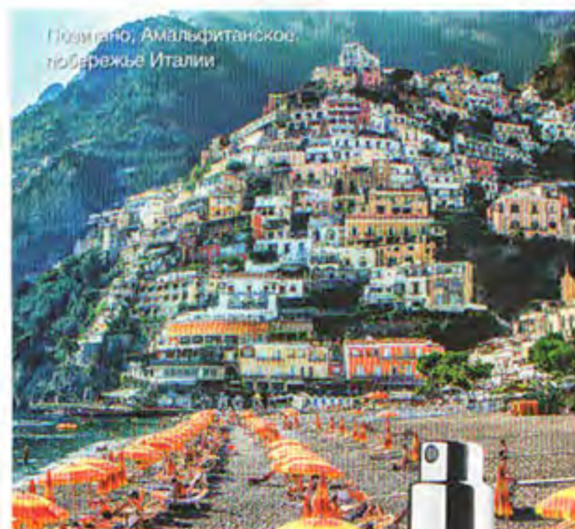
Позитано, Амальфитанское побережье Италии

Что уснуть: в Стрезе — посетите Борромейские острова озера Маджоре: два острова — Изола Мадре и Изола Белла — в XVII веке были превращены во дворцы, окруженные райскими кущами, а остров Изола Пескатори остался рыбацкой деревушкой. В Позитано — остановитесь в отеле Le Sirenuse: он был открыт в 1951 году четырьмя братьями на месте семейного дома, полы в нем выложены расписанной вручную плиткой, а в гостиной можно увидеть антикварную мебель. Во Флоренции — зайдите в музей Officina Profumo — Farmaceutica di Santa Maria Novella рядом с аптекой.