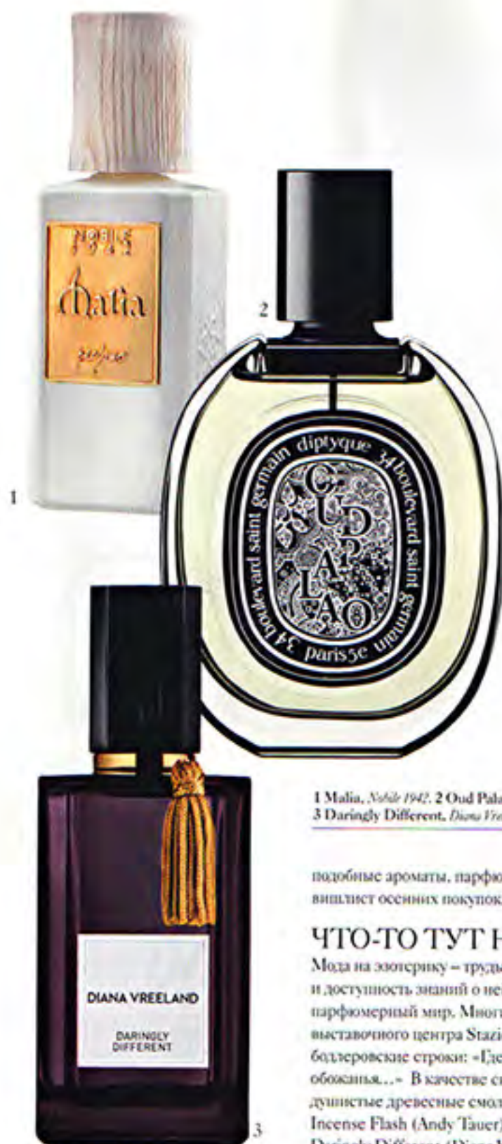
1 Malia, Nobile 1942. 2 Oud Palao, Diptyque. 3 Daringly Different, Diana Vreeland

Проект парфюмерного критика Чендлера Барра - Art Object, Shape, Color and Scent - представленный в рамках выставки. В нем он попытался найти связь между известными ароматами и разными течениями в искусстве