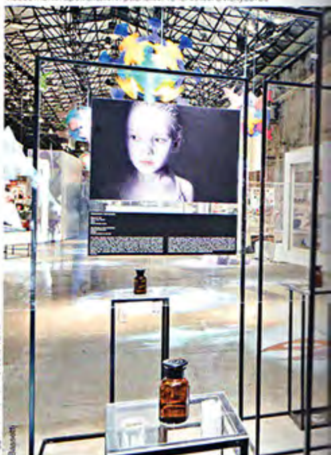
Oggetti d'Arte - 017

Проект парфюмерного критика Чендлера Барра - Art Object, Shape, Color and Scent - представленный в рамках выставки. В нем он попытался найти связь между известными ароматами и разными течениями в искусстве